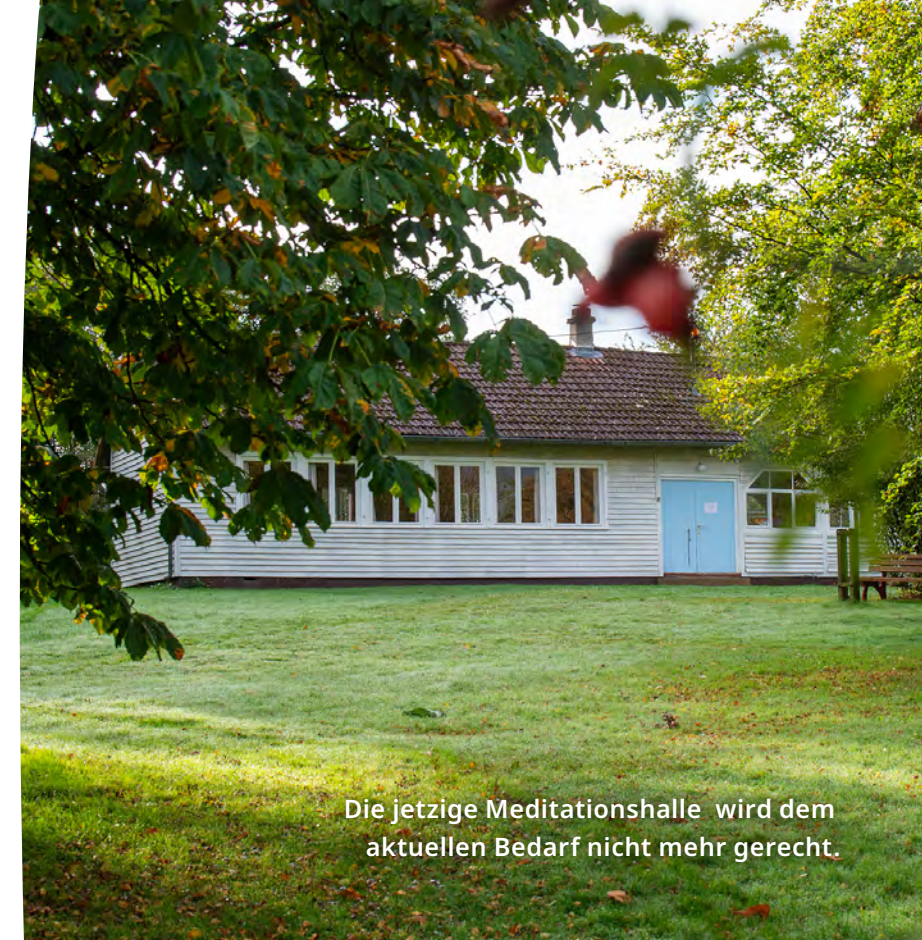
Die jetzige Meditationshalle wird dem aktuellen Bedarf nicht mehr gerecht.

Unser gemeinnütziger Ort ist in der Region gut verankert. Unter diesem Link finden Sie unseren Pressespiegel, der einen Einblick in unsere bisherigen Aktivitäten gibt: