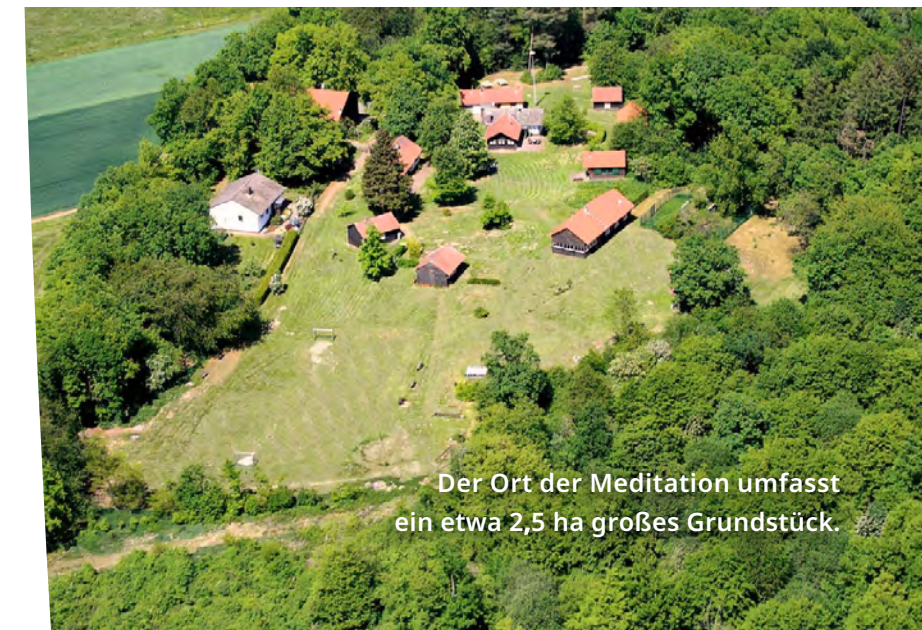
Der Ort der Meditation umfasst ein etwa 2,5 ha großes Grundstück.