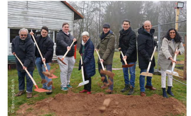
Offizieller Spatenstich mit Vertreter*innen aus der Politik – einschließlich der Bürgermeister –, der Stiftung und den Architekten.

Unser Ziel ist es, den Bau der Meditationshalle zeitnah abzuschließen , damit dieser